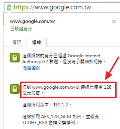
Google 使用 SSL 加密技術

的一個開放源碼（Open Source）實作，SSL 是一種非常流行的加密機制，可以保護使用者透過網際網路傳遞隱密訊息，這就代表了，當你在有 SSL 的網站上所有的通訊資料都被加密了，而也只有該網路的伺服器才可以解開這些加密訊息，如果網路上的攻擊者取得這些訊息，也只能看到一些雜亂無章的英文數字與特殊符號，而無法輕易得知裡面具體的訊息。目前像是 Google、Yahoo、Facebook 都使用這個 SSL 這項技術做加密。