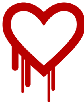
Heartbleed bug 圖案

而這一次在 4 月 7 日發布的 OpenSSL 弱點(CVE-2014-0160)，又稱心臟出血漏洞(Heartbleed bug)，攻擊者有可能透過特殊的手法獲取伺服器記憶體中的資訊，裡面就有機會包含了機敏資訊，例如 SSL 私鑰、session cookie、使用者密碼等，透過這些資料，攻擊者可對由 OpenSSL 保護的網路通信進行解密、偽冒或進行中間人攻擊。